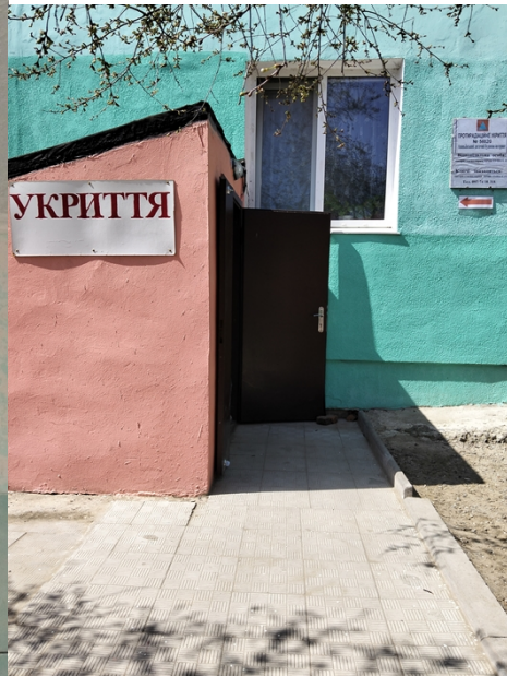
Красносільський дитячий будинок-інтернат: