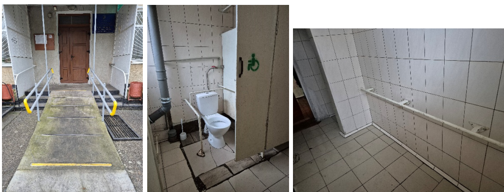
Комунальне некомерційне підприємство «Психоневрологічний інтернат «Оберіг»: