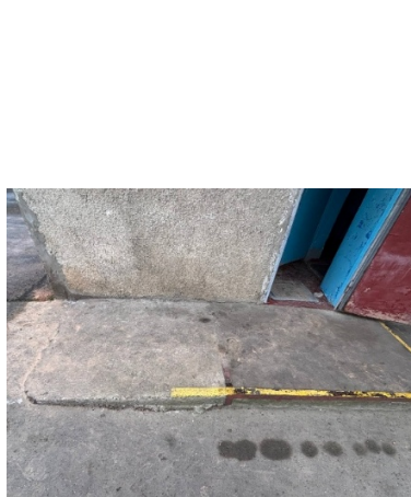
Новосавицький психоневрологічний будинок-інтернат: