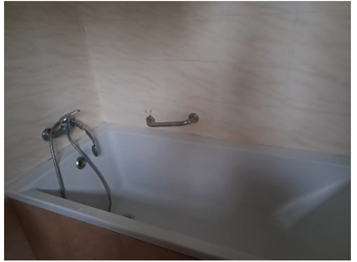
Балтський психоневрологічний будинок-інтернат: