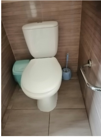
Білгород-Дністровський дитячий будинок-інтернат: