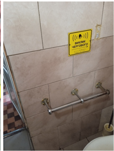
Барабойський психоневрологічний будинок-інтернат: