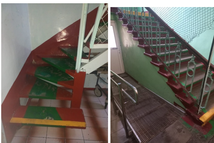
Одеський геріатричний будинок-інтернат: